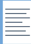
Registrierungs- und Testpflicht beachten