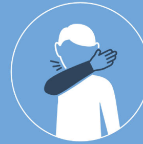
in Armbeuge niesen und husten