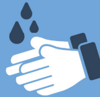
Hände regelmäßig mit Seife waschen