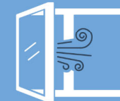
Räume regelmäßig lüften