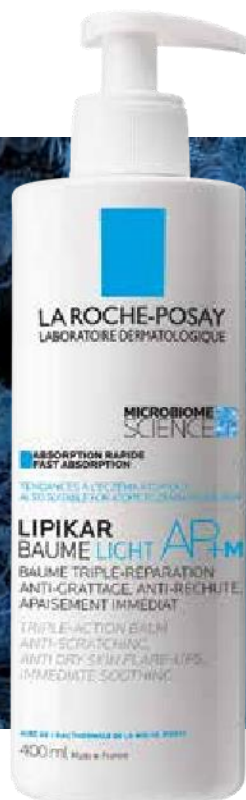
LIPIKAR BAUME LIGHT AP+M