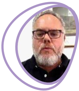
Δημήτριος Ζαφειρίου Καθηγητής Παιδιατρικής Νευρολογίας – Αναπτυξιολογίας Α.Π.Θ.