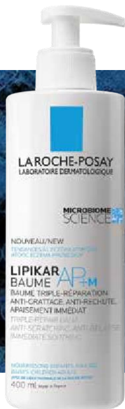
LIPIKAR BAUME AP+M