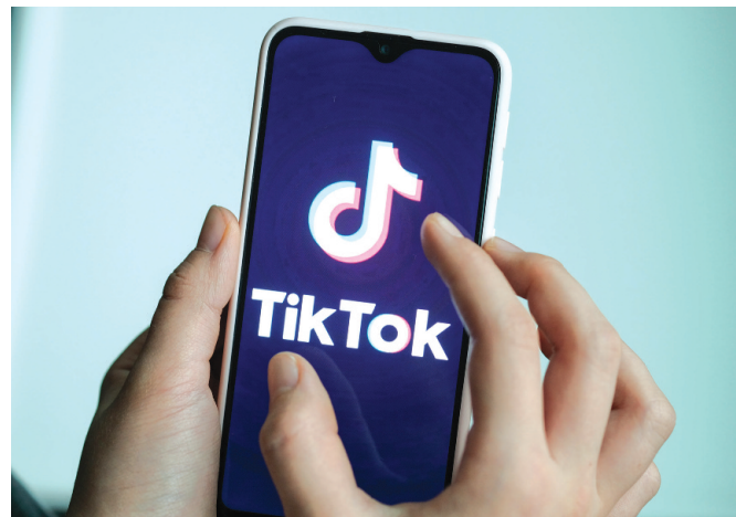
TikTok itself could be valued at $40 billion to $50 billion based on social media multiples and other factors, according to Bloomberg Intelligence

"The best way to address concerns about national security is with the transparent, US-based protection of US user data and systems, with robust third-party monitoring, vetting, and verification, which we are already implementing."